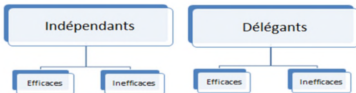
Figure 2 Types d'investisseurs qui définissent les besoins en conseils

L'IFIC cite une étude de Pollara Research qui établit à 87% la part des investisseurs « déléphants » qui acquièrent leurs fonds d'investissements par l'intermédiaire d'un représentant, et CIRANO estime à 6% les investisseurs canadiens (Indépendants-efficaces) qui disposeraient des critères requis pour assumer eux-mêmes la gestion de leurs finances. 29 Des études démontrent que très peu d'investisseurs possèdent les caractéristiques et les habiletés pour gérer eux-mêmes leurs investissements. 30 Par conséquent, le marché des conseils en ligne demeurerait très limité. Les besoins pour des conseils plus étendus, comme il a été mentionné plus haut, demeurent la norme. (Voir la note 19). Il serait inquiétant que davantage d'investisseurs se voient résigner aux services de conseils en ligne, et qu'ils viendraient grandir la proportion d'investisseurs inefficaces, parce qu'ils auraient de la difficulté à obtenir les services d'un conseiller financier expérimenté. En particulier, les épargnants du marché de masse qui ont un besoin d'éducation financière en seraient les premières victimes. Enfin, des déplacements peuvent être observés dans le modèle des types d'investisseurs présenté à la figure 2, certains investisseurs « indépendants-inefficaces » devenant des investisseurs « déléphants », alors que certains investisseurs « déléphants-efficaces » pourraient devenir des investisseurs « indépendants ».